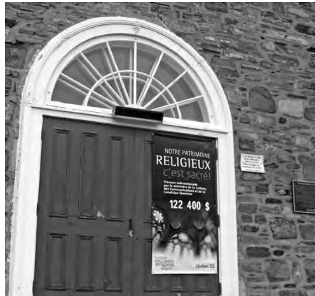
Restauration du parvis à l'église Saint-Jean-Baptiste, Saint-Jean-Port-Joli

La bannière « Notre patrimoine religieux, c'est sacré! » identifie les projets de restauration qui bénéficient de l'aide financière du Conseil du patrimoine religieux du Québec et du ministère de la Culture, des Communications et de la Condition féminine. Le montant de la subvention est ajouté à la bannière lorsque cette aide financière est égale ou supérieure à 100 000 $. Comme le stipule le protocole d'entente, cette bannière doit être installée de manière très visible sur l'édifice subventionné pendant toute la durée des travaux.