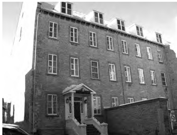
Aile Saint-Joseph du Monastère des Ursulines de Québec