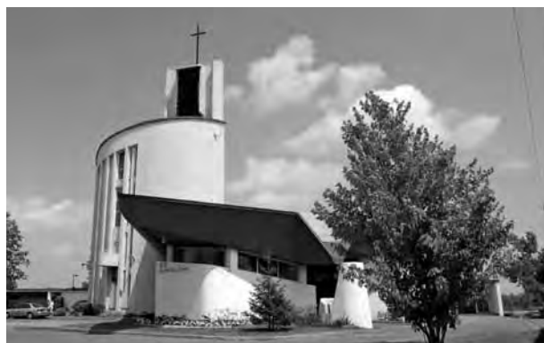
Église Notre-Dame-d'Anjou, Montréal

Dans le cadre de l'Entente sur le développement culturel entre la Ville de Montréal et le ministère de la Culture, des Communications et de la Condition féminine, et avec la participation du Conseil du patrimoine de Montréal, le Conseil a poursuivi et terminé la réalisation de l'évaluation patrimoniale et de la classification de 210 lieux de culte construits entre 1945 et 1975 sur le territoire de l'île de Montréal.