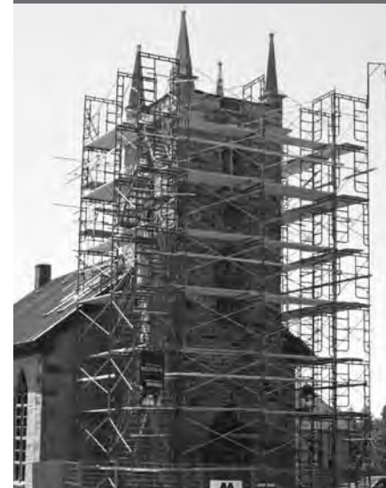
Église unie Saint-Mungo, Brownsburg-Chatham DSF inc. Architecture et Design

Ainsi, la Fondation a modifié sa raison sociale pour celle de Conseil du patrimoine religieux du Québec afin de mieux représenter les réalités de ses activités et d'élargir son mandat. Celui-ci avait été limité, jusque là, à la gestion du programme de financement des projets de restauration du patrimoine religieux immobilier et mobilier, à la réalisation d'inventaires et, dans une moindre mesure, à des activités de sensibilisation telles que des colloques sur le patrimoine religieux, tandis qu'il vise maintenant à faire, du nouveau conseil, un « partenaire » des communautés religieuses, du gouvernement, des municipalités, des municipalités régionales de comté (MRC) et de tout autre intervenant dans le domaine.