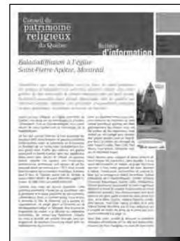
www.lieuxdeculte.qc.ca Visiteurs de l'année 2007

Publié quatre fois par année, le bulletin d'information du Conseil s'est aussi refait une beauté au printemps 2007. Sa mise en page a été repensée, une nouvelle « image de marque » du Conseil étant appliquée à l'ensemble des communications de l'organisation. Le Conseil sera donc facilement identifiable dans toutes ses publications et ses actions au sein de sa nouvelle mission élargie.