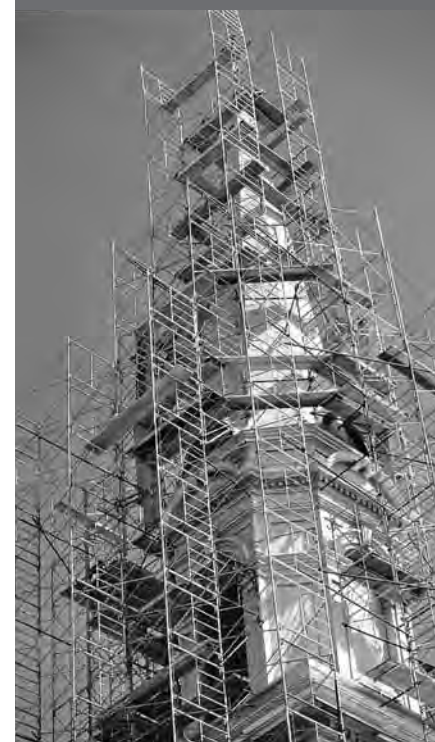
Église Saint-Joseph, Carleton-sur-Mer Architectes Proulx & Savard