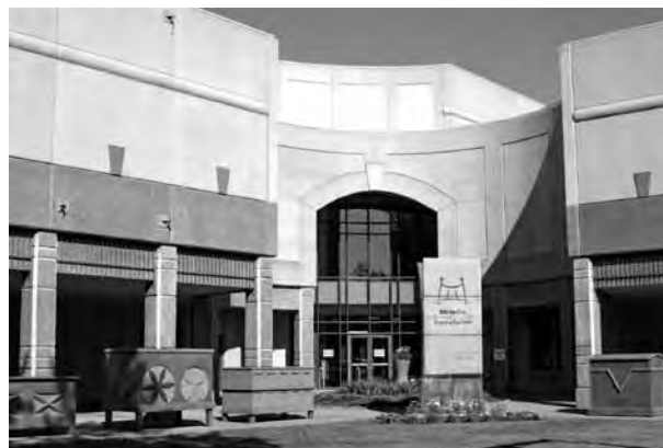
Musée québécois de culture populaire, Trois-Rivières