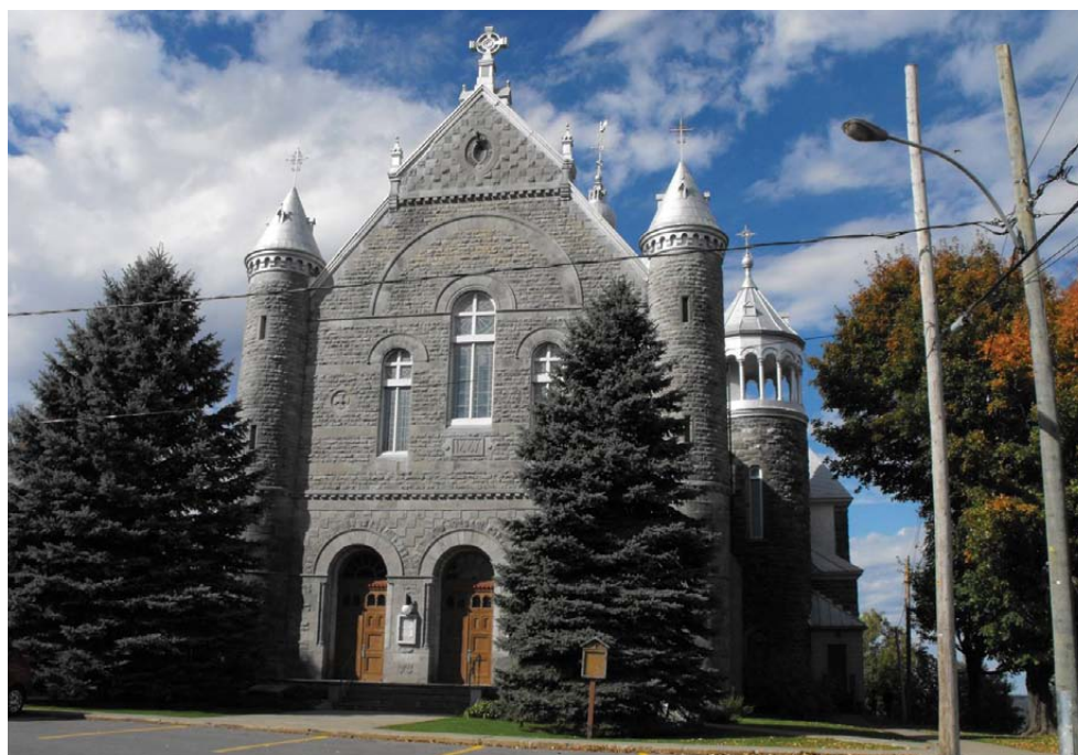
ÉGLISE SAINT-ANICET.

Réaménager l'espace pour mieux rassembler la collectivité