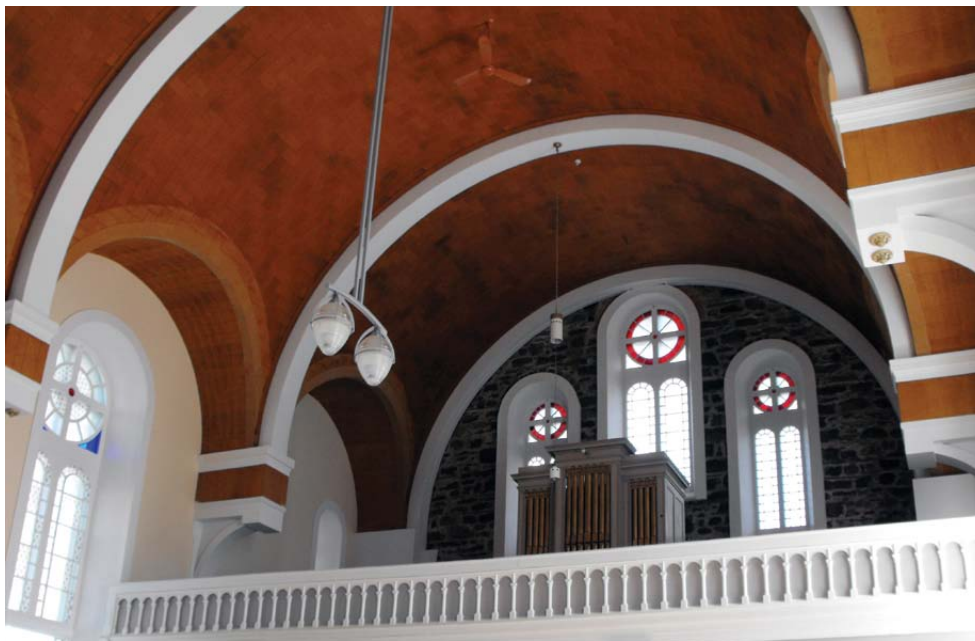
VUE VERS LA TRIBUNE ARRIÈRE APRÈS LA TRANSFORMATION EN CENTRE COMMUNAUTAIRE.

Le processus d'acquisition de l'église, du presbytère et du terrain par la municipalité de Saint-Anicet arrive à terme le 26 mars 2010. Il aura fallu cinq ans de réflexion de la part de la municipalité, suivi d'un an de négociation avec la fabrique, pour finalement acquérir la propriété. Cet achat est réalisé pour un montant de 12 501 $. Des clauses sur le droit d'usage du bâtiment sont inscrites au contrat de vente, dont une qui spécifie le maintien d'un espace pour la pratique du culte. La possibilité d'obtenir des subventions pour la conversion du bâtiment facilite le processus de son transfert de propriété.