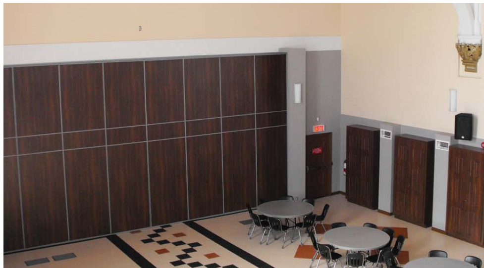
VUE DE LA SALLE COMMUNAUTAIRE AVEC LA PORTE FERMÉE QUI LA SÉPARE DU LIEU DE CULTE.