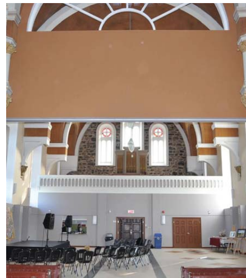
VUE VERS LA SALLE COMMUNAUTAIRE À PARTIR DU TRANSEPT.