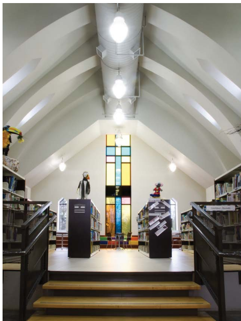
SECTION JEUNES DE LA BIBLIOTHÈQUE.

« Une qualité de volumes, de lumière naturelle et une âme qui procurent une expérience forte [...] »