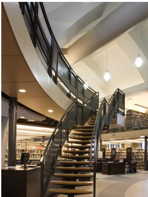
ESCALIER MENANT À LA MEZZANINE.

L'église, construite en 1953 et 1954 selon les plans de l'architecte Roland Dumais, est localisée dans la partie sud-ouest de la Ville de Joliette, à proximité de plusieurs institutions scolaires. L'église est caractérisée par l'architecture de Dom Bellot, architecte bénédictin. Il s'agit d'une réinterprétation du style gothique, mais selon une esthétique plus épurée favorisant ainsi la géométrie, comme nous pouvons le constater sur la façade du bâtiment. L'église est réalisée selon un plan à croix latine avec un chœur en saillie. Son aménagement intérieur d'origine est composé d'une nef à un vaisseau avec une tribune à l'arrière. Le bâtiment compte également un baptistère. Les façades du bâtiment sont revêtues de pierres. Une structure constituée principalement d'arcs polygonaux en béton crée un grand volume voûté.