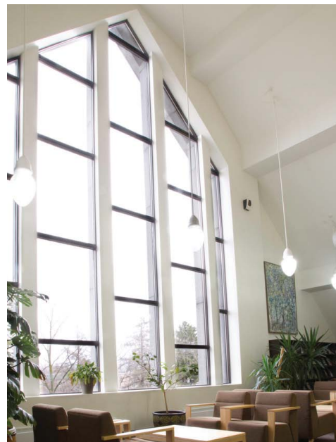
AIRE DE LECTURE.