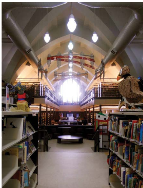
PERSPECTIVE CENTRALE DE LA BIBLIOTHÈQUE.