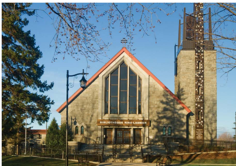
VUE EXTÉRIÈURE DE LA BIBLIOTHÈQUE RINA-LASNIER ET DE SON CLOCHER MODIFIÉ.

Une bibliothèque au cœur de sa collectivité