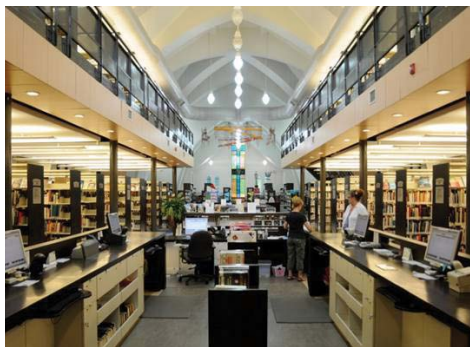
VUE INTÉRIÈURE APRÈS LA TRANSFORMATION EN BIBLIOTHÈQUE.