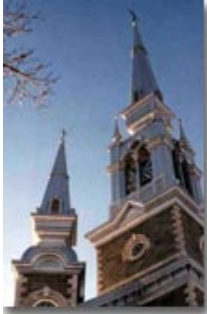
Église Sainte-Victoire de Victoriaville