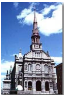
Église Saint-Jean-Baptiste de Québec