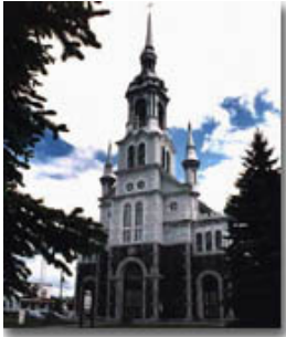
Église de Saint-Basile de Portneuf

Les architectes montréalais sont particulièrement influencés par les églises néoromanes américaines. Le néoroman est le style international de l'architecture religieuse du 19 e siècle, celui des États-Unis, mais aussi celui de France, où il est alors privilégié pour l'architecture paroissiale. Les architectes s'intéressent aussi à l'éclectisme français (à la fois néorenaissance, néoroman et romano-byzantin), qui s'est manifesté dans plusieurs édifices prestigieux, cathédrales, sanctuaires votifs et de pèlerinage. Dans la région de Québec, les nouveaux monuments français contribueront beaucoup au renouvellement de l'architecture des églises. L'architecte Peachy, en plus de s'inspirer des réalisations du Second Empire, trouve dans les nouvelles églises de pèlerinage françaises des modèles notamment pour ses clochers. Parmi les concepteurs d'églises les plus créatifs de la période, se trouve un prêtre architecte du diocèse d'Ottawa, le