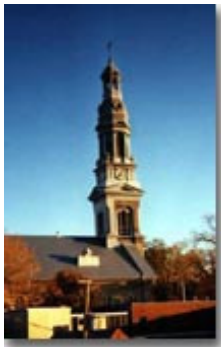
Le clocher de l'église Saint-Sauveur de Québec

Dans un pays où la tradition classique était si profondément ancrée et où le néogothique n'a pas connu de large développement, l'éclectisme marque un tournant important. Tant de changement ne peut s'expliquer que par une nette volonté d'affirmation, de distinction et montre que l'architecture de nos églises est à la recherche d'une nouvelle identité. À partir des années 1880, apparaissent des bâtiments novateurs dont la composition et l'ornementation sont parfaitement maîtrisées.