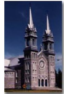
Église de Saint- Casimir de Portneuf