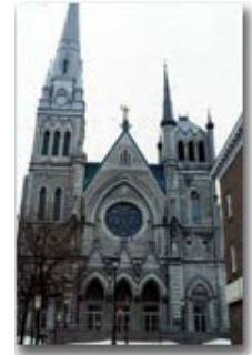
Cocathédrale Saint-Antoine-de-Padoue de Longueuil

Si près de 60 % des quelque 2 000 églises catholiques québécoises ont été construites depuis 1940, le tournant du présent siècle a aussi été une active période de construction. Il subsiste environ 300 de ces édifices religieux construits entre 1880 et 1910, ce qui représente près de 20 % de toutes les temples catholiques québécois. Généralement monumentales, ces églises marquent avec évidence le paysage québécois. Longtemps étiquetés grandiloquents ou triomphalistes, ces bâtiments recevaient peu la faveur des historiens. En conséquence, le désintéressement envers ceux-ci a amené nombre de démolitions et de rénovations drastiques qu'on regrette aujourd'hui 1 .