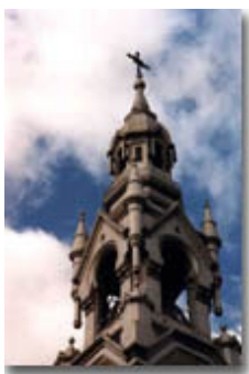
Église Saint-Mathieu de Beloeil

On dit de l'éclectisme en architecture qu'il est le mouvement venu révolutionner la notion de style. Il a amené une libération des cadres formels anciens et la création à partir de la réinterprétation des styles anciens. Comme l'éclectisme est un exercice très personnel, très variable selon la formation et l'aise plus ou moins égales des architectes, il est considéré avant tout comme un style d'auteur et reste encore pour plusieurs assez énigmatique. En revanche, comme le signale Jean-Pierre Épron dans le récent ouvrage qu'il consacre à l'éclectisme, la démarche éclectique ne débat pas que de style, mais fait aussi une large place aux débats à la fois technique et politique 2 . L'éclectisme est une démarche par laquelle l'architecte tente de se créer une place d'autorité dans le processus de construction, par une maîtrise des systèmes techniques et de la composition formelle et par un apport éclairé aux besoins de la société. Au Québec, c'est d'ailleurs à cette époque que les architectes se dotent d'une association professionnelle (1890) et qu'est instauré le premier programme d'enseignement de l'architecture (1896).