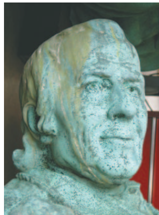
La corrosion et les fientes d'oiseaux présentes sur la statue de M gr Bourget nuisent grandement à la lisibilité de l'œuvre.

Devant la cathédrale Marie-Reine-du-Monde (alors appelée Saint-Jacques-le-Majeur), on inaugurerait, en 1903, un monument en hommage à M gr Ignace Bourget. L'œuvre de l'artiste Louis-Philippe Hébert se compose de plusieurs sculptures de bronze : de part et d'autre de M gr Bourget, qui s'élève au centre du monument, deux figures allégoriques, représentant la Charité et la Religion, se trouvent à la base du monument, également ornée de deux bas-reliefs présentant des scènes de la vie de l'évêque. Les sculptures ont été coulées au sable - une technique répandue au début du XX e siècle - en plusieurs pièces et assemblées par la suite, à l'aide de goujons et de boulons de bronze ou d'acier en certains endroits.