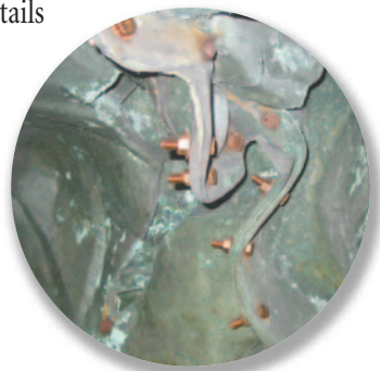
À l'intérieur de la figure La Charité, qui fait partie du monument de M gr Bourget, les boulons d'acier corrodés (en haut) sont remplacés par un nouveau boulonnage en bronze silicium.

Le travail structural consiste principalement à remplacer la boulonnerie d'acier corrodée et laminée par de nouvelles pièces en bronze au silicium, un matériau plus résistant à la corrosion. Le monument se trouvant exposé aux intempéries, son étanchéité à l'eau est importante et, par conséquent, de petits trous présents à la surface doivent être colmatés à la résine époxy.