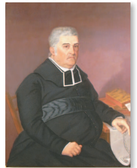
Le même portrait, une fois la restauration complétée, est beaucoup plus éclatant.