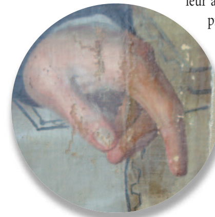
Détail du portrait, pendant le travail de nettoyage : la saleté et le vernis jauni ont été retirés sur la partie de gauche. Les écaillages de la couche picturale sont bien visibles.

bénéficier d'une véritable cure de rajeunissement, mais attention! ils doivent quand même conserver l'apparence que leur a conférée leur vieillissement. C'est dans le choix des limites de l'intervention que se trouve l'un des principaux défis auxquels doivent faire face les restaurateurs.