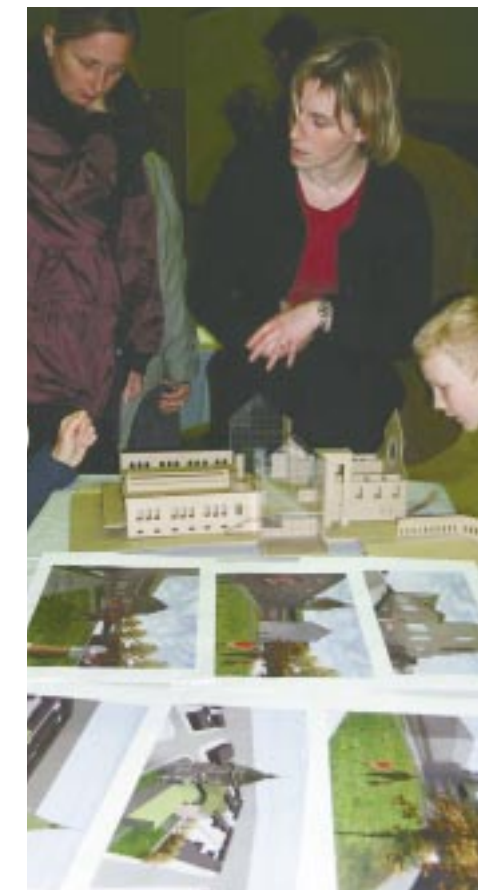
Projet de Annie Tétreault et Marjolaine Kishka-Gaumont.