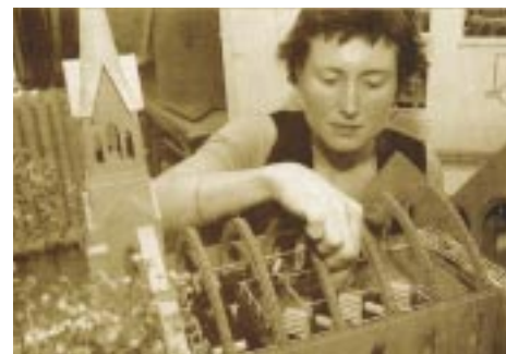
Projet de Julye Boucher

L'église Saint-Joseph présente une certaine souplesse relativement à sa réutilisation, puisque l'espace principal de rassemblement est dépourvu de colonnes. Lors d'une rencontre avec les étudiants, le nouveau propriétaire les a invités à considérer des aspects sensoriels (lumière,