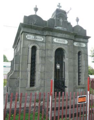
Cimetière Baie-du-Febvre

La fédération Écomusée de l'Au-Delà, en collaboration avec la Société québécoise d'ethnologie, présente un colloque sur l'avenir des cimetières au Québec.