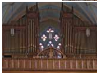
Orgue de tribune de l'église Saint-Frédéric, Drummondville (Casavant Frères, Opus 1448, 1931)