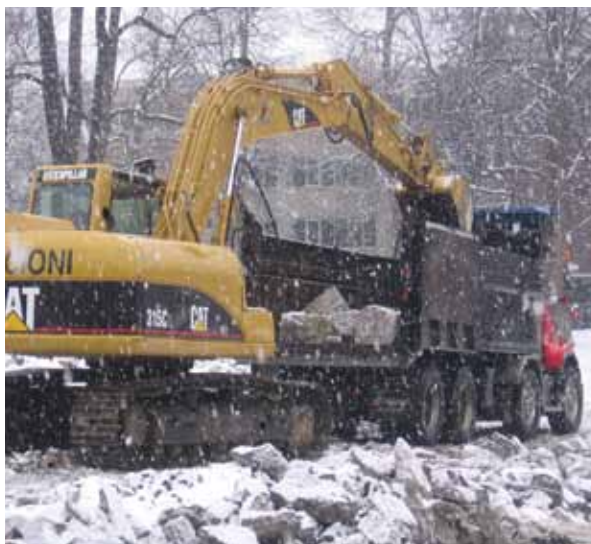
© Istvan Kovacs, DFS inc. Architecture et Design

L'histoire aurait pu se terminer ainsi. Toutefois, les architectes mandatés pour la restauration de la façade de la basilique Saint-Patrick, sise à environ un kilomètre à l'est sur la même artère, étaient justement à la recherche de pierre calcaire pour effectuer ces travaux. Communément appelé pierre grise de Montréal, ce matériau emblématique de la ville, autrefois extrait des anciennes carrières de l'île, est devenu très difficile à trouver. Les pierres, provenant de gisements exploités à l'extérieur de Montréal et de Laval, sont rarement de la bonne teinte et, par conséquent, elles ne s'agencent pas parfaitement avec la maçonnerie des bâtiments anciens.