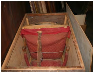
Sept fauteuils à dossiers dits « à la Reine » (c.1740) Jean Nadal Univers culturel de Saint-Sulpice