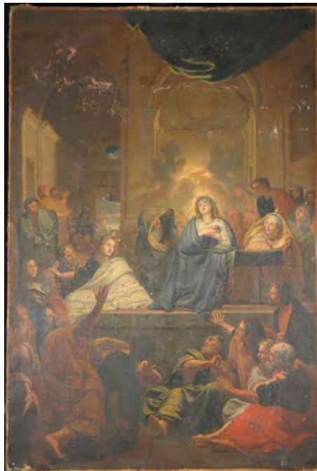
La Pentecôte (c.1655) Charles LeBrun (attribué à) Univers culturel de Saint-Sulpice