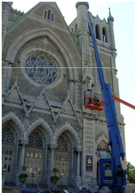
Remise en place des statues.