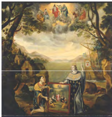
La France apportant la foi aux Hurons de la Nouvelle-France (c.1666)