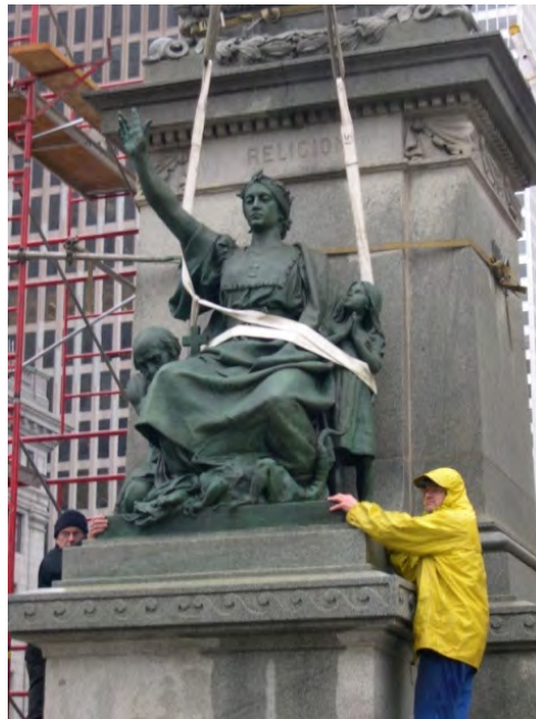
Monument en hommage à Mgr Ignace Bourget (1903, bronze) Louis-Philippe Hébert Cathédrale Marie-Reine-du-Monde