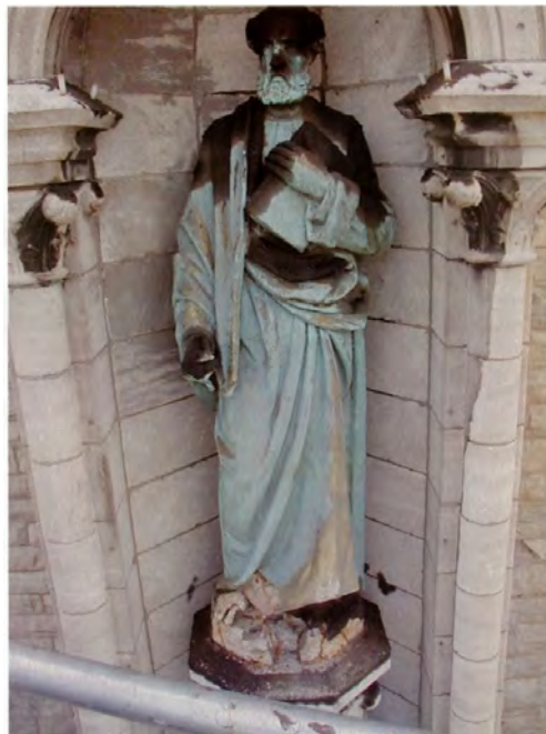
Saint Pierre et saint Paul (1885) Louis-Philippe Hébert et Thomas Carli Cocathédrale Saint-Antoine-de-Padoue