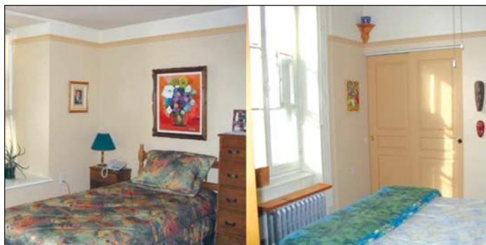
Figure 6 Chambres de deux logements des Habitations du Trait-Carré. Remarquez la profondeur de l'appui de fenêtre sur lequel on a placé des plantes d'intérieur (à gauche). On peut ouvrir toute la fenêtre à battants ou seulement le carreau central du côté droit, comme l'illustrent les deux photos.

Une telle base de données contribuerait à dissiper les mythes sur la réaffectation, tout en aidant les équipes qui planifient des projets à cerner les problèmes potentiels, à éviter les pièges et à proposer de nouvelles solutions mobilisatrices dans un processus d'amélioration constante. Malgré une documentation exhaustive de l'état du bâtiment, des imprévus peuvent survenir après le début des travaux. Généralement, le budget prévoit une allocation pour imprévus de 10 %, mais certains architectes recommandent plutôt de porter cette allocation à 15 ou 20 % pour faire face aux coûts imprévus des projets de réaffectation.