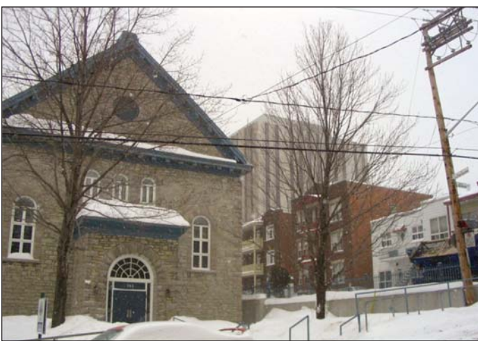
Figure 3 Domaine des Franciscains, dans son environnement. L'édifice à bureaux qui apparaît à l'arrière est situé sur une artère principale de la Haute-Ville.

On a restauré l'extérieur des bâtiments, mais on a accordé moins d'importance à la préservation des éléments patrimoniaux intérieurs. Dans bien des cas, on a complètement modifié