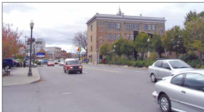
Figure 2 Arrière du Centre Jacques-Cartier le long du boulevard Charest, illustrant son contexte urbain.

Ils ont enfin consulté des membres de la communauté religieuse et de l'organisme sans but lucratif ou caritatif, le promoteur, l'urbaniste municipal en chef et les représentants municipaux et provinciaux du logement qui ont participé à chacun des projets étudiés. Ils leur ont notamment demandé de l'information sur les budgets des projets, sur les restrictions, le cas échéant, au programme de subvention de l'organisme, ainsi que sur les politiques qui pourraient avoir influé sur la conception et la gestion du projet d'habitation.