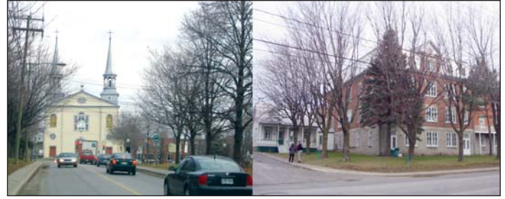
Figure 4 Extérieur de l'ancien couvent-école et sa relation avec l'église paroissiale à l'extrémité du quadrilatère, dans le quartier historique du Trait-Carré.

l'intérieur des bâtiments pour assurer la fonctionnalité des espaces. Pour des raisons budgétaires, on a dû inclure le plus grand nombre de logements possible, de sorte que des modifications majeures à l'aménagement intérieur se sont souvent imposées.