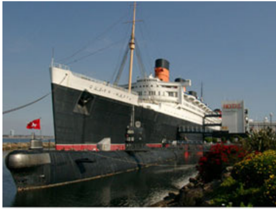
Queen Mary